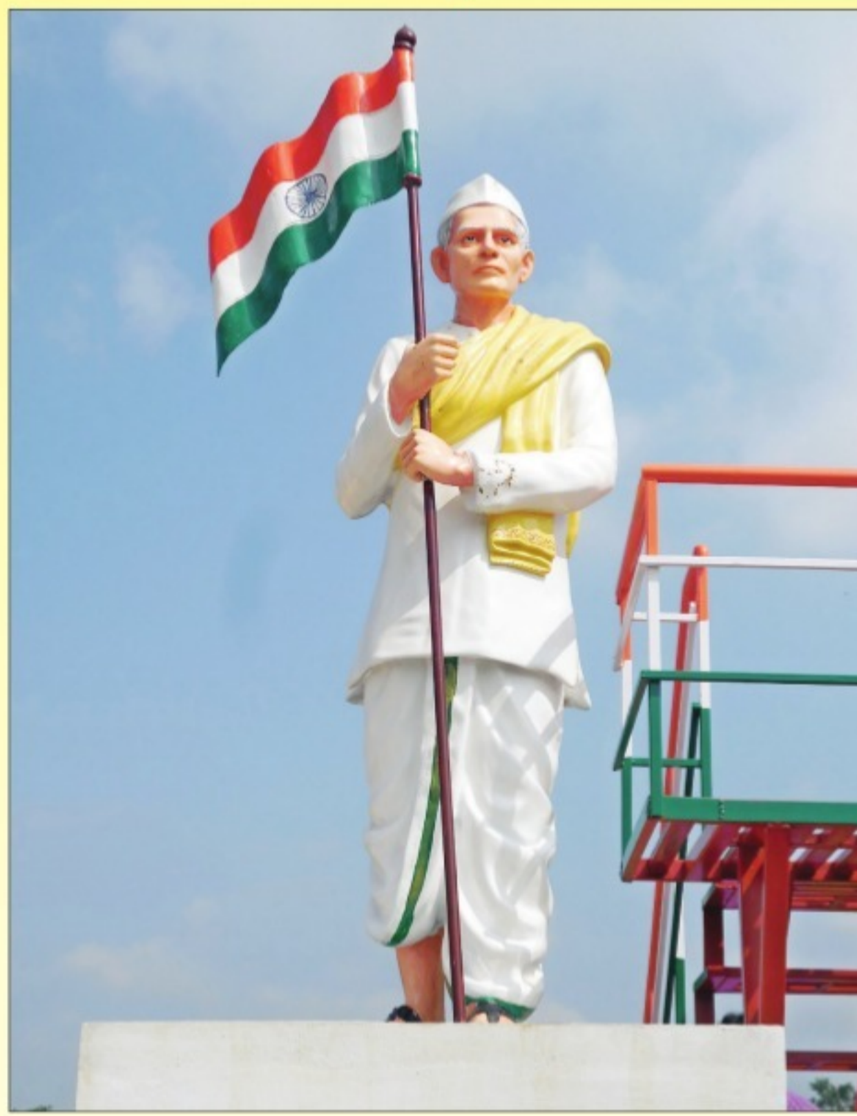
చల్లపల్లిలోని నిలువెత్తు విగ్రహం

దృష్టికి కూడా వెళ్లటంతో ఆయనకు రాయల్ అగ్రికల్చర్ సొసైటీ సభ్యత్వమిచ్చి గౌరవించారు. వజ్రాల పై కూడా పరిశోధనలు సాగించి వజ్రపు తల్లిరాయిని కనుగొన్న